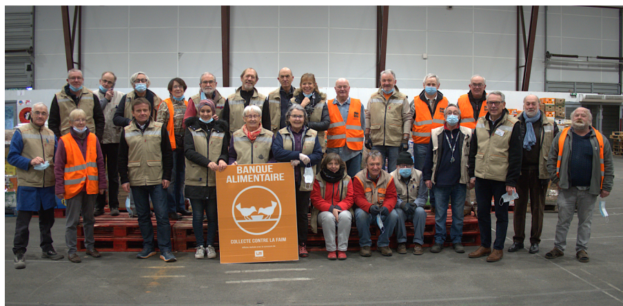
Des bénévoles encore plus investis en raison de la crise sanitaire.

La mise en œuvre de nouvelles actions de promotion des dons (sacs préparés, collecte dématérialisée, meilleure implication des magasins...) a dynamisé la Collecte Nationale des 27 et 28 novembre 2020 qui s'est pourtant déroulée dans un contexte sanitaire inédit. Grâce à la mobilisation de 3500 bénévoles répartis dans 146 magasins, elle a permis de récolter 255 tonnes de produits secs contre 176 tonnes en 2019, soit un bond de 45 %.