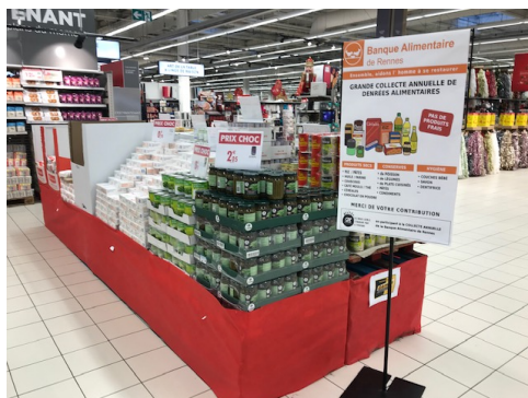
Bon exemple d'un îlot avec affiche informative.

La mise en œuvre de nouvelles actions de promotion des dons (sacs préparés, collecte dématérialisée, meilleure implication des magasins...) a dynamisé la Collecte Nationale des 27 et 28 novembre 2020 qui s'est pourtant déroulée dans un contexte sanitaire inédit. Grâce à la mobilisation de 3500 bénévoles répartis dans 146 magasins, elle a permis de récolter 255 tonnes de produits secs contre 176 tonnes en 2019, soit un bond de 45 %.