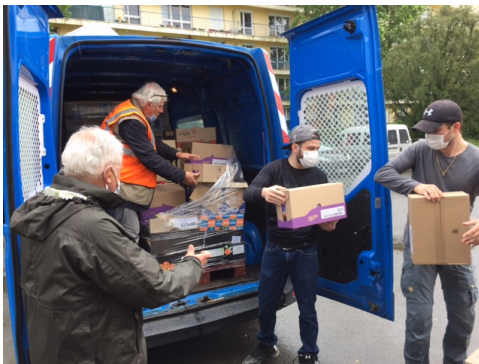
Livraison par un bénévole de la BA au Village Alimentaire.