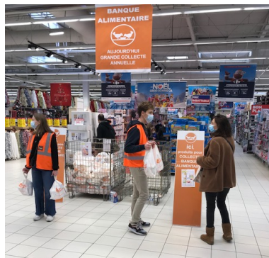
Deux jeunes bénévoles proposant des sacs préparés (Carrefour Alma).