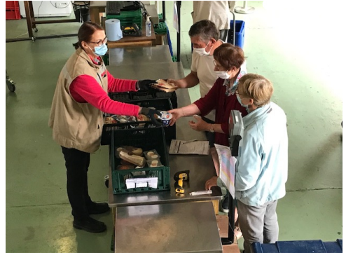
Adoption du mode DRIVE pour la distribution aux associations (ici EPICOM Noyal sur Vilaine).