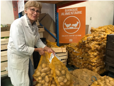
Don de pommes de terre d'un nouveau producteur "Le Gouessant" (Lamballe).

La crise du Covid a révélé une vision nouvelle de l'aide alimentaire et la nécessité de trouver des moyens nouveaux pour rapprocher l'offre et les besoins.