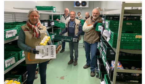
Préparation de commandes dans l'extension de la chambre froide ( 2,2 tonnes/jour )