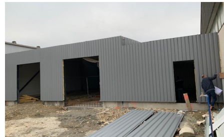
16 décembre : La façade de l'extension prend forme