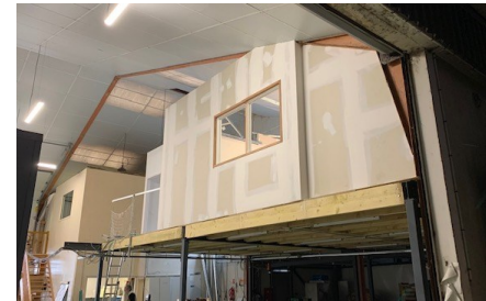
10 mars : Construction de la mezzanine