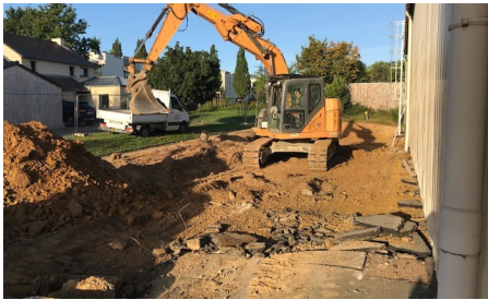
30 septembre 2021 : Préparation du terrain avant travaux