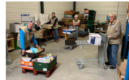
Aux préparations des commandes des produits secs ( 3,6 tonnes/jour )