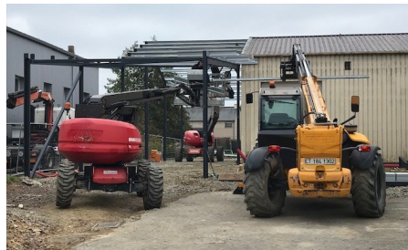
16 novembre : L'extension est en cours de construction