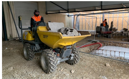
6 janvier 2022 : À l'intérieur tout reste à faire

Démarrés en octobre 2021, les travaux se sont achevés à la mi-mai. L'extension de 475 m 2 et les aménagements divers (espace de stockage, extension d'une chambre froide, quai de livraison supplémentaire avec plateforme élévatrice, mezzanine pour création de bureaux supplémentaires) ont coûté 747 000 €.