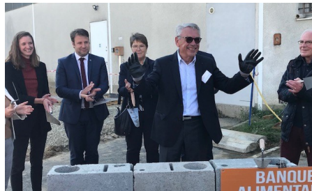
15 octobre : Pose de la première pierre