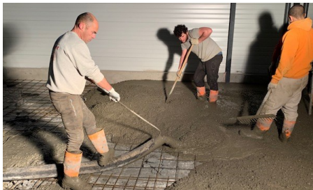
2 février : Coulage des dalles en béton