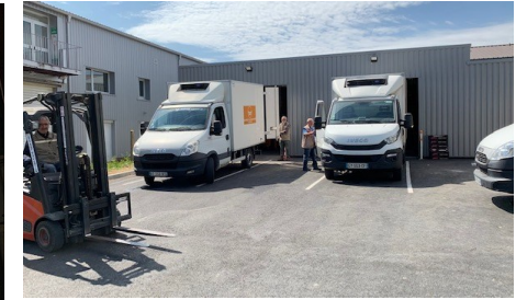
12 Avril : Les camions devant les 2 nouveaux quais