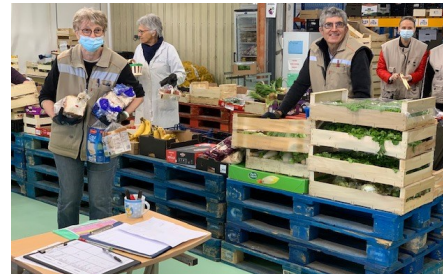
Au tri des fruits et légumes ( 1,2 tonnes/jour )

Bravo à tous les bénévoles de la Banque Alimentaire ou des Associations Partenaires, pour leurs efforts, la compréhension et la patience dont ils ont fait preuve durant les travaux d'extension de l'entrepôt.