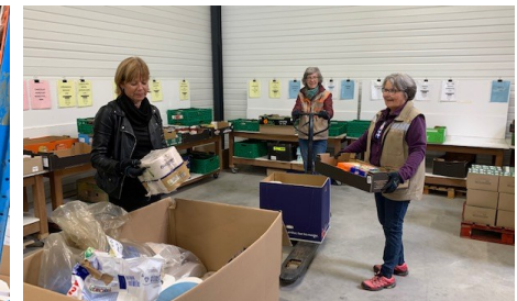
Au tri des produits de ramasse ( 3,2 tonnes/jour )