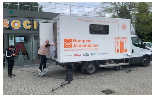
← Le camion cuisine devant l'association étudiante « Epi-Free » de Rennes 1 (4 mai 2023)

Notre démarche « Bons gestes et bonne assiette » véhiculée depuis 2022, par notre camion-cuisine sur l'ensemble de notre territoire, participe à la promotion d'un système d'alimentation durable. Un outil autour du mieux manger à petit budget.