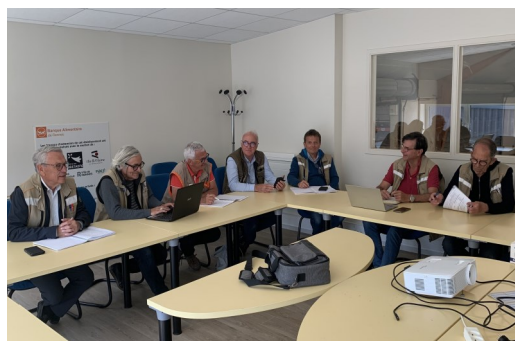
← La configuration « Drive » depuis 2020 et la nouvelle salle de réunion