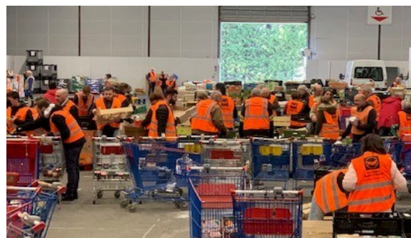
← Les bénévoles lors du tri de la collecte au SPACE (28 novembre 2022)

C'est pourquoi, nous agissons pour que la mise à disposition de denrées alimentaires soit associée au lien social dans un processus d'accueil, d'écoute et d'accompagnement des personnes soutenues.