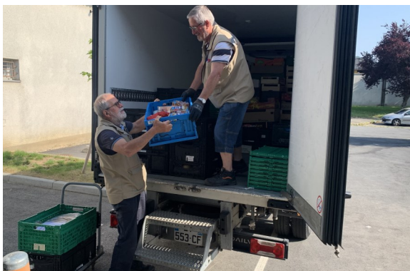
← Les bénévoles déchargent les produits frais provenant de la ramasse quotidienne.

Reste que nos donateurs réguliers, auxquels sont associés les transporteurs, continuent à faire preuve de solidarité envers les plus démunis, mais on mesure que le don volontaire devra prendre le pas sur le don subi.